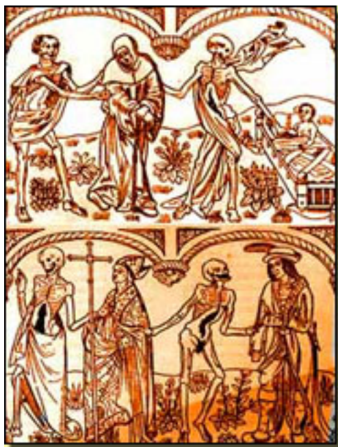
Guy Marchant (1485)

En 1485 el parisino Guy Marchant publicó grabados y uno Chaucer de una danza cuatro