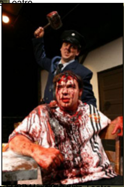
(McDonagh, Martin, 2006, The Cripple in the Chair , Alcará de Teatro)