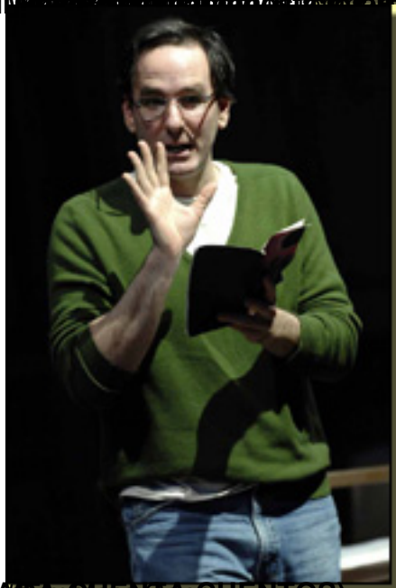
(McDonagh, Martin, 2006, The Cripple in the Chair , Alcará de Teatro)