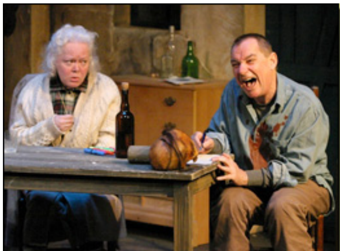
(McDonagh, Martin, 2006, The Cripple in the Chair , Alcará de Teatro)

Jueves, 15 de Abril de 2010 10:59 - Actualizado Jueves, 13 de Mayo de 2010 16:32