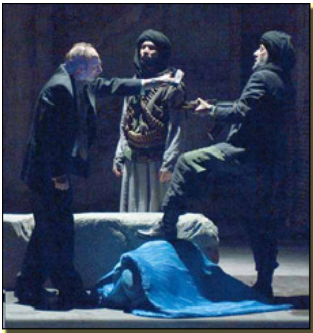
EN CASA/EN KABUL

Han transcurrido ocho meses. Cuando comenzamos los ensayos, los talibanes aún controlaban la mayor parte de Afganistán; antes del primer preestreno, habían desaparecido.