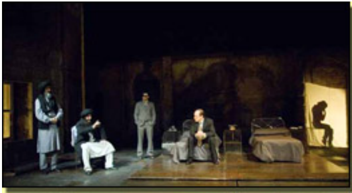
EN CASA/EN KABUL