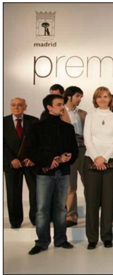
PREMIADOS DE LA VILLA DE MADRID 2007

Jueves, 15 de Abril de 2010 09:07 - Actualizado Viernes, 14 de Mayo de 2010 12:41