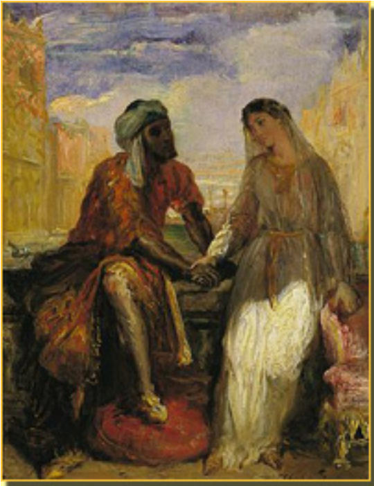
OTELLO, cuadro de THÉODORE CHAUSSÉRION

- Lo veo difícil, pero están las lecturas dramatizadas, que es una fórmula útil para que puedan llegar a la escena, aunque sea de una manera incompleta.