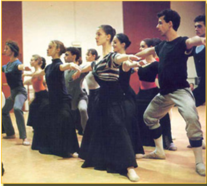
ENSAYO DE LA COMPAÑÍA (1988)

Jueves, 15 de Abril de 2010 15:14 - Actualizado Viernes, 14 de Mayo de 2010 19:48