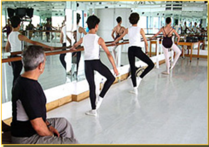
ESCUELA V. ULLATE 2008

- Ya te he dicho que el mundo de la creación es muy satisfactorio. Lo que ahora me preocupa son mis alumnos. No es que tenga miedo a perderlos, porque estén donde estén siempre te dan un nombre y prestigio, si son buenos. Lo que me preocupa es qué será de ellos, porque como yo lo he pasado tan mal durante mis años de chaval..., entonces se les coge muchísimo cariño y me preocupa la idea de qué harán, dónde irán. El entusiasmo que muestran en la clase, cómo aplauden, cómo se comportan, hace que me diga: «Bueno; es importante que la escuela tenga su propia compañía..., como meta, como salida a este trabajo y a ese esfuerzo de años»