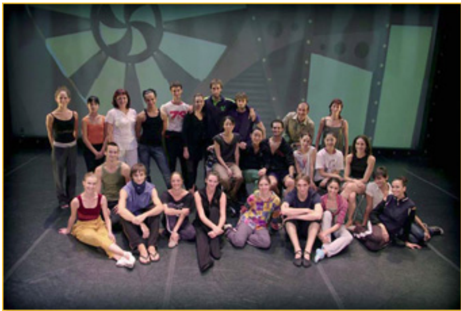
COMPAÑÍA COMUNIDAD DE MADRID (VÍCTOR ULLATE) (2008)