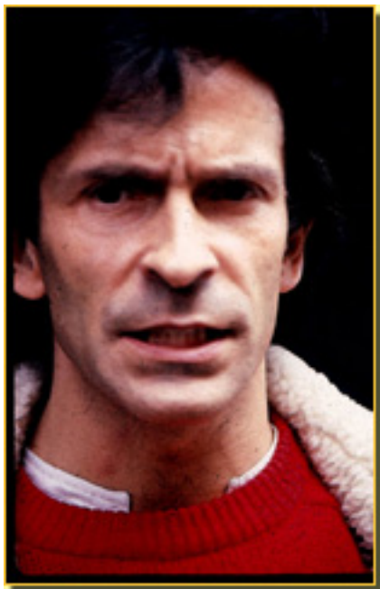
víctor ullate (1988)

Jueves, 15 de Abril de 2010 15:14 - Actualizado Viernes, 14 de Mayo de 2010 19:48