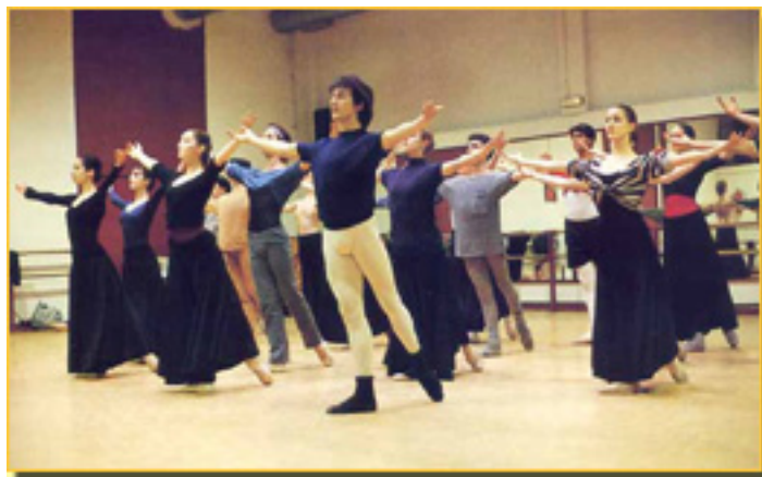
COMPañÍA VÍCTOR ULLATE (1988)