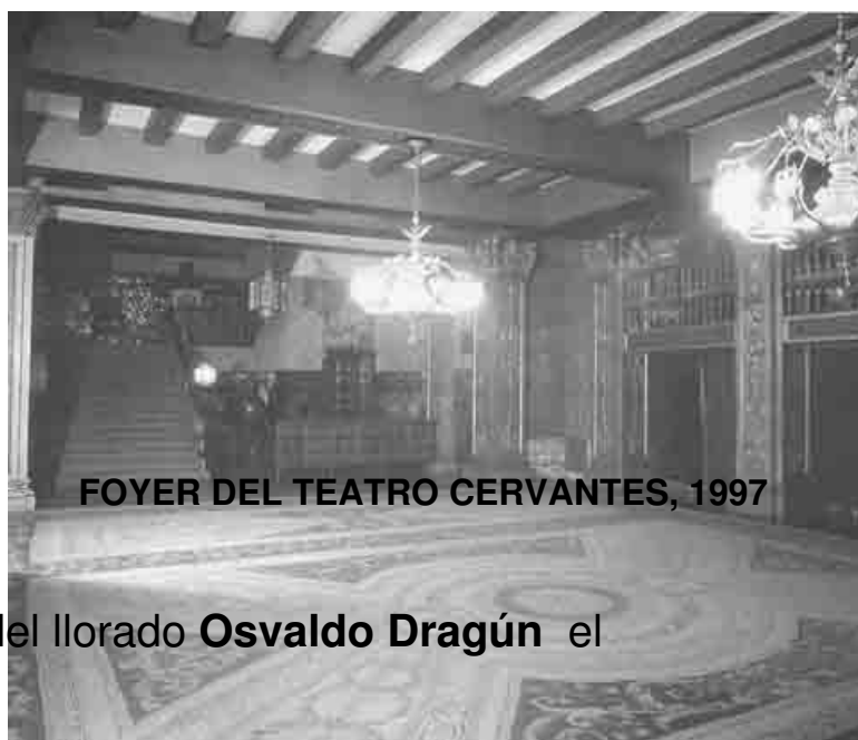
FOYER DEL TEATRO CERVANTES, 1997

. Sigue dependiendo de la Presidencia de la Nación, a través de la Secretaría de Cultura, pero goza de mayor independencia para administrar sus recursos y por supuesto, para definir los criterios artísticos a seguir.