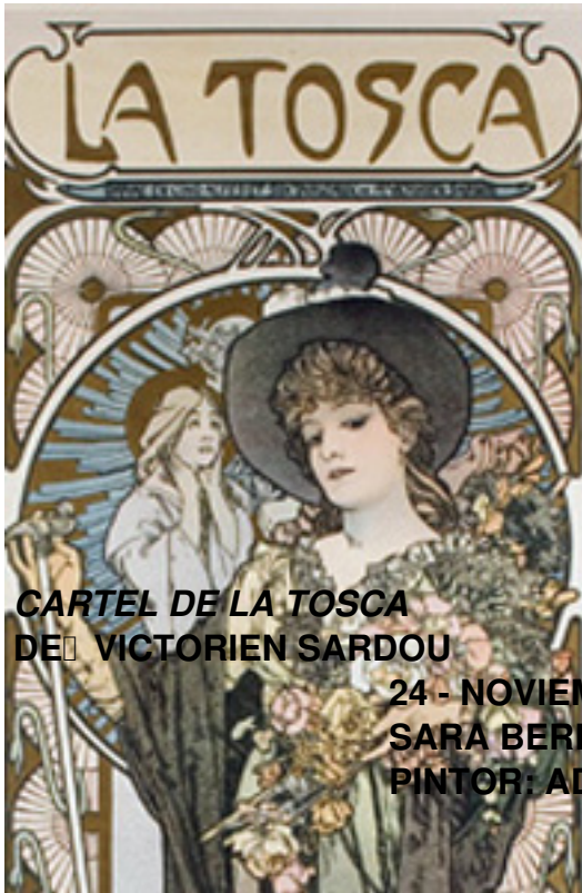
CARTEL DE LA TOSCA DE VICTORIEN SARDOU