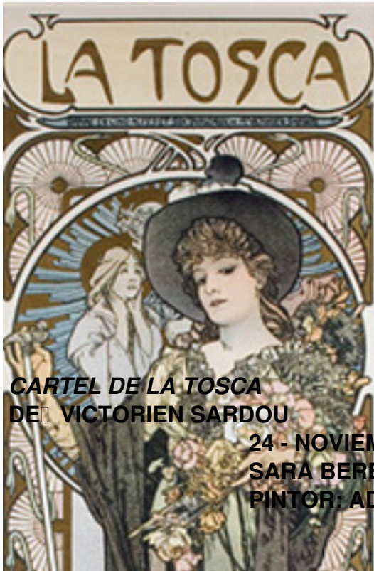
CARTEL DE LA TOSCA DE VICTORIEN SARDOU