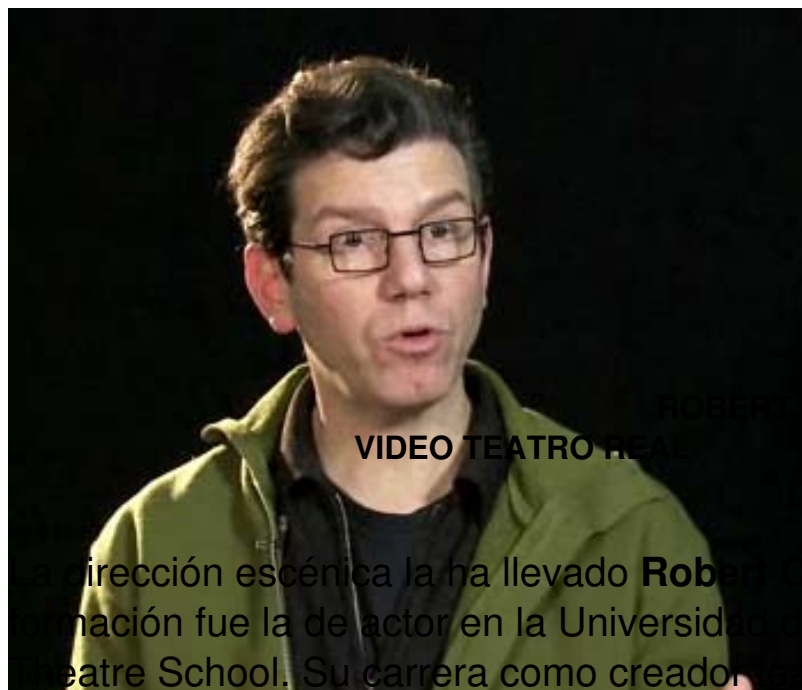
ROBERT CARSEN VIDEO TEATRO REAL

La dirección escénica la ha llevado Robert Carlsen (Canadá), cuya primera formación fue la de actor en la Universidad de York y en el Bristol Old Vic Theatre School. Su carrera como creador teatral se ha combinado con las realizaciones operísticas, por las que se le han concedido premios internacionales. No es la primera vez que dirige en el