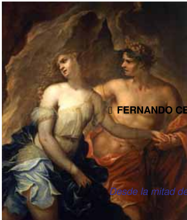
▯ FERNANDO CERVELLI

Martes, 01 de Junio de 2010 09:41 - Actualizado Sábado, 23 de Marzo de 2013 23:50