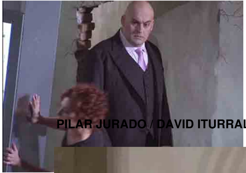
PILAR JURADO / DAVID ITURRALDE