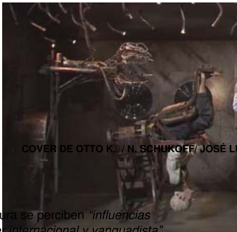
COVER DE OTTO K. / N. SCHUKOFF/ JOSÉ L.

Titus reconoce que en la partitura se perciben “ influencias españolas, que no oscurecen el carácter internacional y vanguardista ”