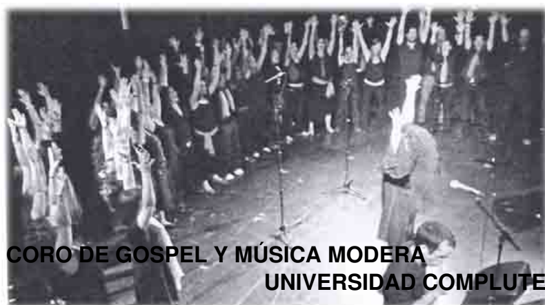
CORO DE GOSPEL Y MÚSICA MODERNA UNIVERSIDAD COMPLUTENSE DE MADRID

Director Cultural de GECESA Obrera Social