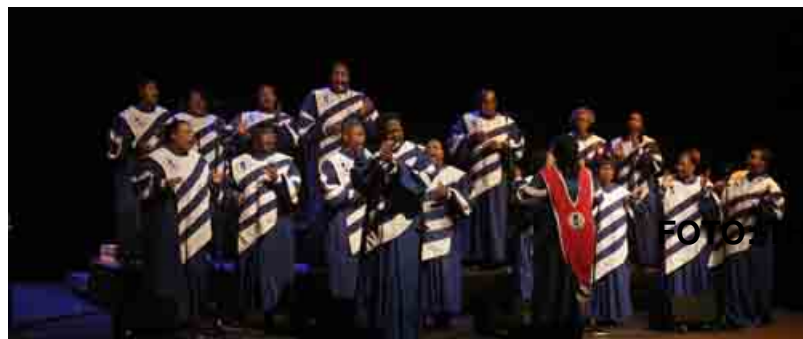
FOTO: THE MISSISSIPPI MASS CHOIR