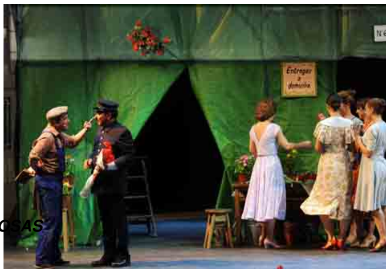
LA DEL MANOJO DE ROSAS

La historia se desarrolla en 1934, por lo tanto en la cercana preguerra española. Es un libreto que no conviene, pues, trasladar a nuestra época, porque tiene bastantes connotaciones y alusiones históricas.