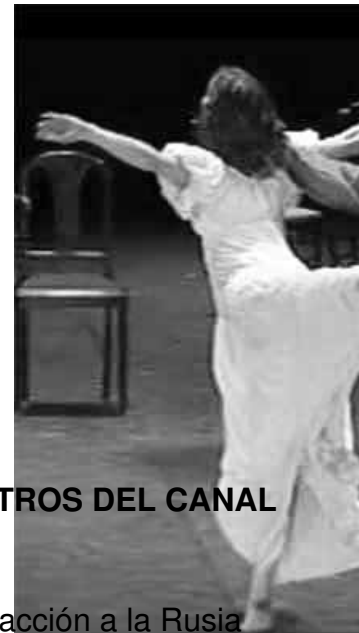
FOTO TOMADA DE LA VERSIÓN DE 2013 REESTRENADA EN LOS TEATROS DEL CANAL

Con música de Prokóiev esta versión traslada la acción a la Rusia de la Revolución, en Kiev.