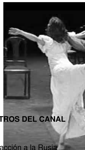
FOTO TOMADA DE LA VERSIÓN DE 2013 REESTRENADA EN LOS TEATROS DEL CANAL

Con música de Prokóiev esta versión traslada la acción a la Rusia de la Revolución, en Kiev. pertenece a la Rusia blanca y