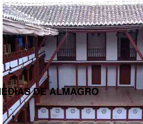
CORRAL DE COMEDIAS DE ALMAGRO

conocedor del mundo clásico, consigue un trabajo actoral de gran cohesión.