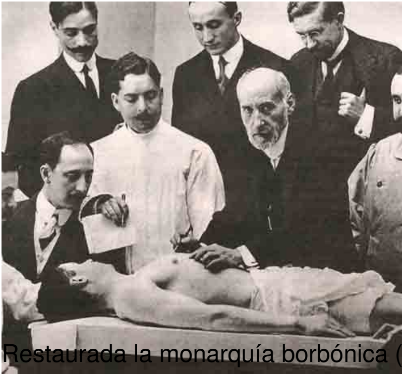
SANTIAGO RAMÓN Y CAJAL □

Restaurada la monarquía borbónica (1875), el gobierno de España fue proclive a limitar libertades en la enseñanza. Se prohibía todo lo que atacara directa o indirectamente a la monarquía y a la religión católica. No se hicieron esperar las protestas de profesores y estudiantes. Francisco Giner de los Ríos y Nicolás