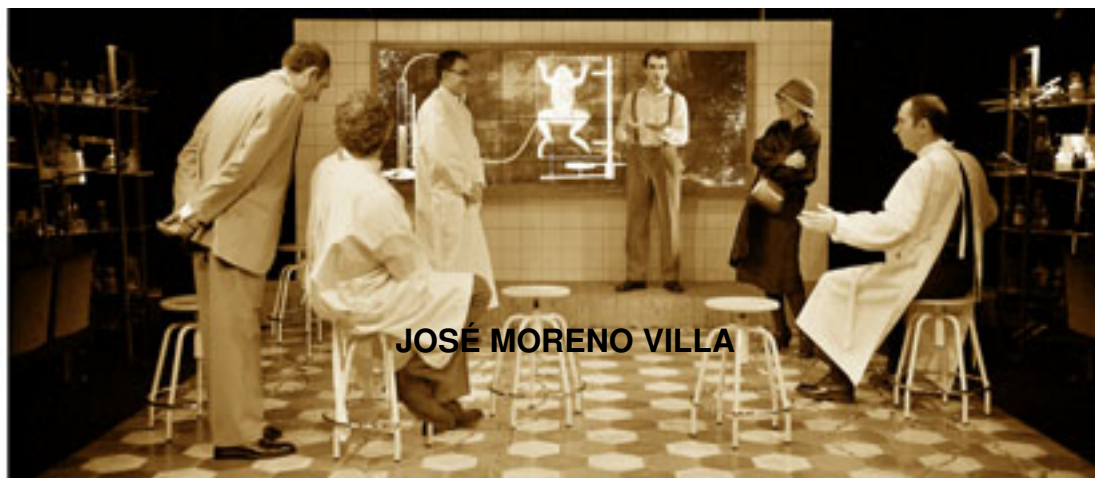
JOSÉ MORENO VILLA