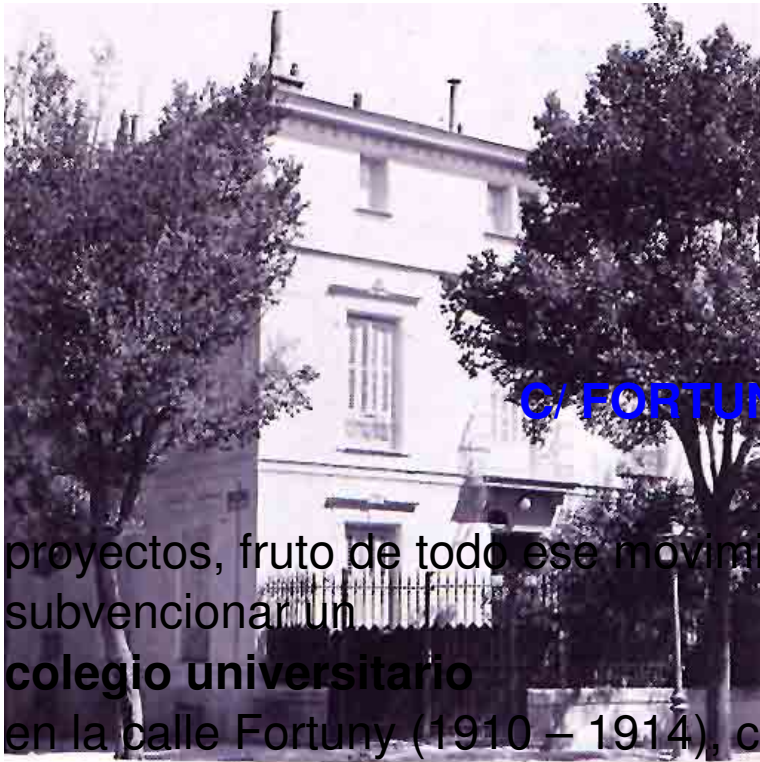
C/ FORTUNY, MADRID. RESIDENCIA DE ESTU

Uno de los proyectos, fruto de todo ese movimiento, fue crear y subvencionar un pequeño colegio universitario en la calle Fortuny (1910 – 1914), cuya filosofía era: