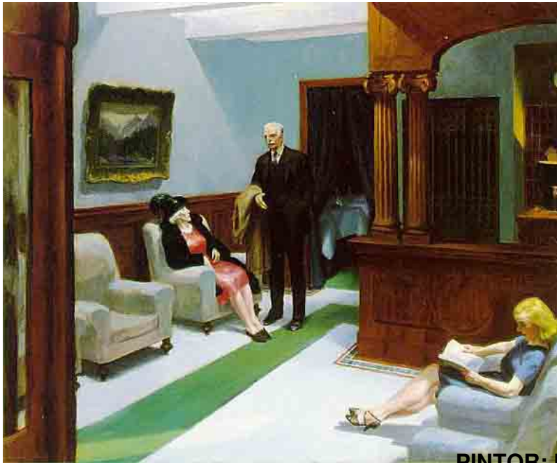
PINTOR: EDWARD HOOPER

Suite termina por ser una obra en clave de misterio que nos habla del eterno dilema entre el intento de realizar los sueños o la posibilidad de convertir en ficción nuestro pasado. Carles Batlle, propio de su teatro, no da resouestas definitivas.