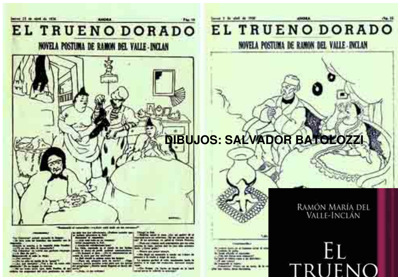
DIBUJOS: SALVADOR BATOZZZI