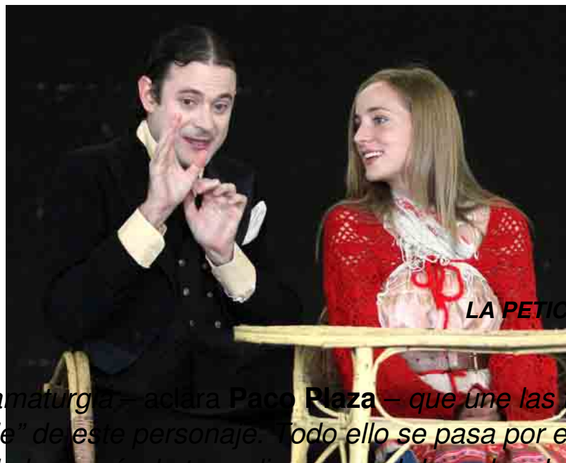
LA PETICIÓN DE MANO

El viaje del actor cuenta con las tres Chéjov de , pero no es un enchoriza