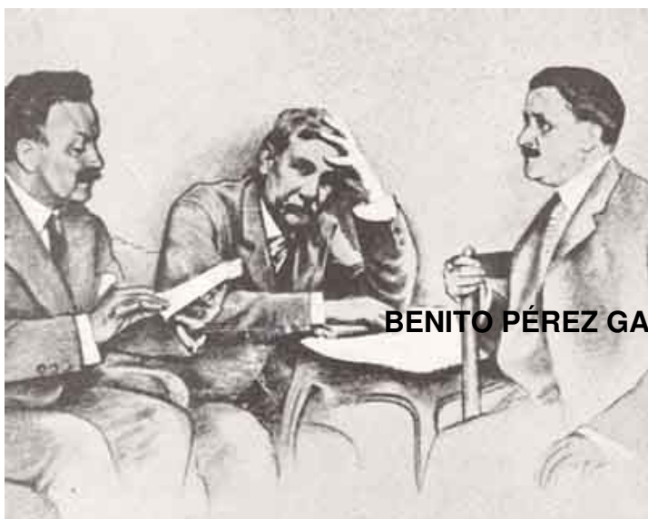
BENITO PÉREZ GALDÓS con los hermanos ALVAREZ

El estreno de ELECTRA! Episodio nacional, con fecha inconvencible, "Tea