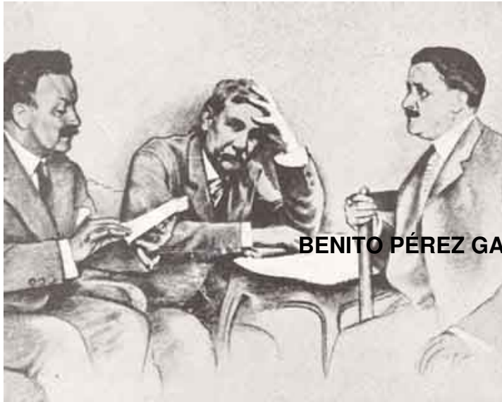
BENITO PÉREZ GALDÓS con los hermanos ALVAREZ

El estreno de ELECTRA! Episodio nacional, con fecha inconvencible, "Tea