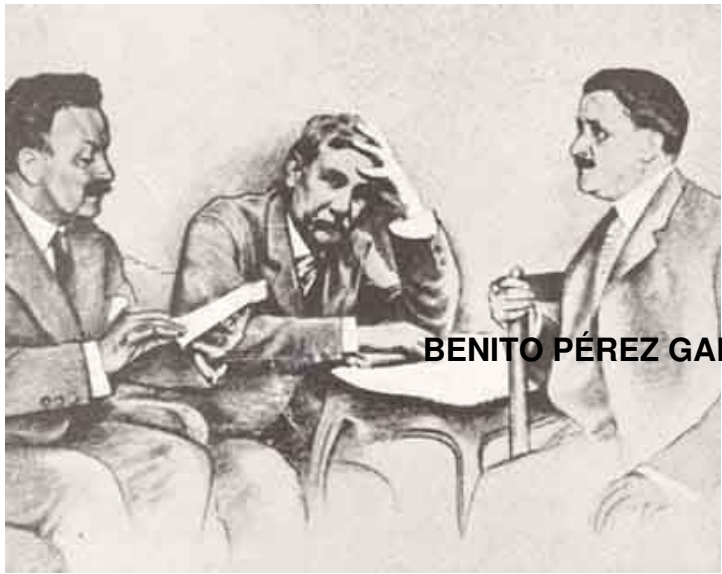
BENITO PÉREZ GALDÓS con los hermanos ALVAREZ

- ¡ El estreno de ELECTRA! Episodio nacional, con fecha inconmovible, “Tea