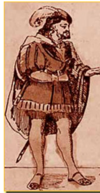
FAUSTO Y MARGARITA

En ese trastocar los sexos Faust-Bal también la