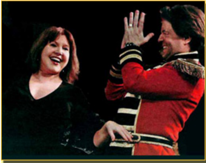
LOLES LEÓN/E. R. DELPORTAL

La Gran vía es género chico, ya saben que el apelativo no le viene por ser un género menor, sino por su duración 1 hora como máximo, tiempo demasiado corto para un espectáculo de hoy. Generalmente se representaba con otra obra del género chico. Los criterios de este “ayuntamiento” eran diversos y no vamos a entrar en ello. En el caso que nos ocupa,