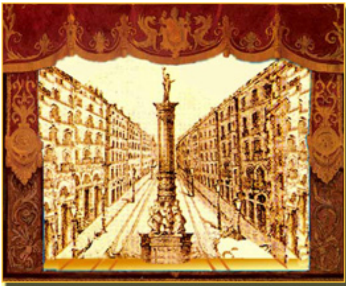
LA GRAN VÍA , 1886

■ La Gran Vía de Federico Chueca , no solamente fue un “boom” en su época sino que quedó en el repertorio y se representó con generosidad por todas las Compañías. Al Teatro de la Zarzuela ha venido en varias ocasiones. La última con versión de Adolfo Marsillach .