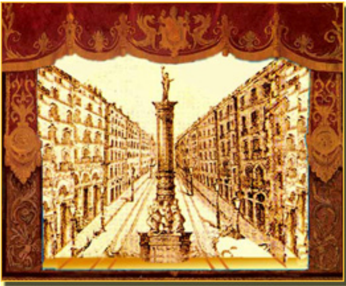
LA GRAN VÍA , 1886

■ La Gran Vía de Federico Chueca , no solamente fue un “boom” en su época sino que quedó en el repertorio y se representó con generosidad por todas las Compañías. Al Teatro de la Zarzuela ha venido en varias ocasiones. La última con versión de Adolfo Marsillach .