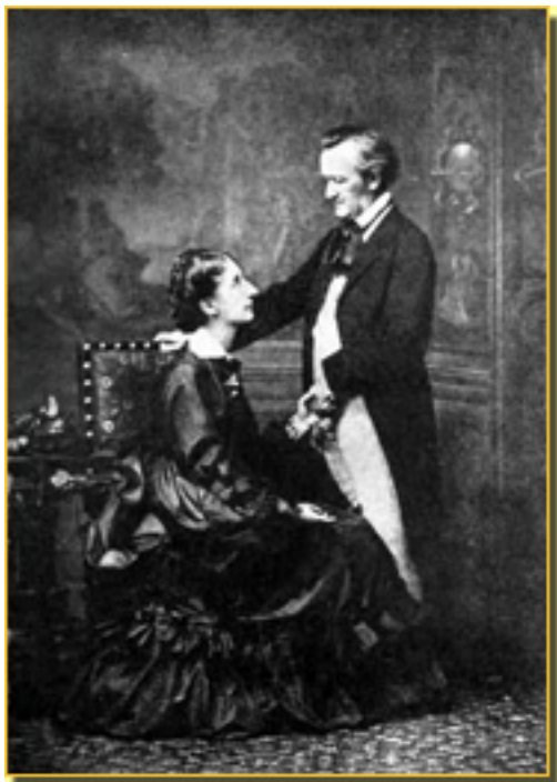
COSIMA WAGNER RICHARD WAGNER