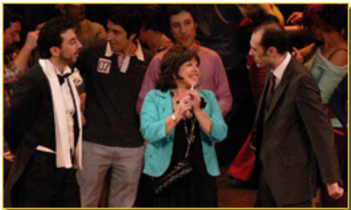
MARCO MONCOLA/LOLES LEÓN/