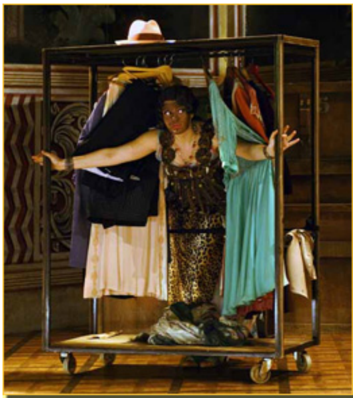
UNA REPÚBLICA BANANERA Y TIRANO BANDERAS

- ¿Por qué jugar con Vale esto? La respuesta es que es de música tradicional de la zona.