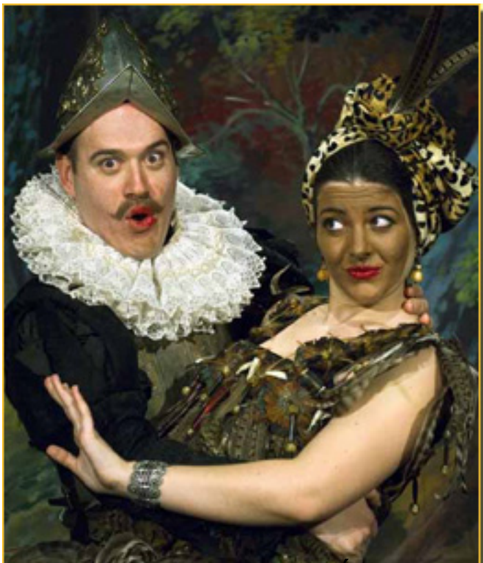
FOTOPRIMERAS DEL DÚO EN LA AFRICANA DE MEYERBERG

Lunes, 08 de Febrero de 2010 13:01 - Actualizado Sábado, 08 de Mayo de 2010 14:51