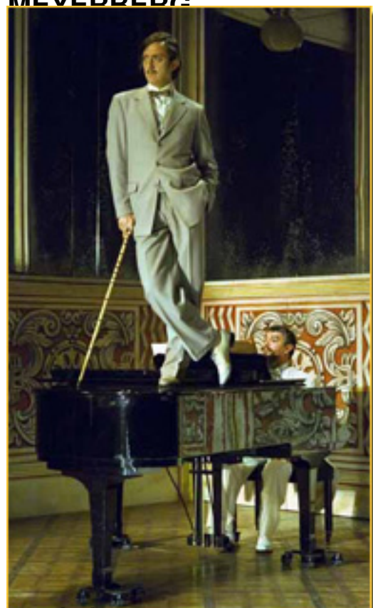
FOTOGRAFÍA DE LOS ACTORES EN LA AFRICANA DE MEYERBERG