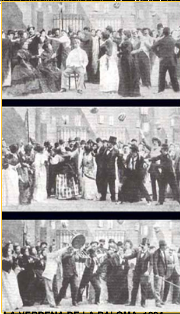
LA VERBENA DE LA PALOMA, 1894