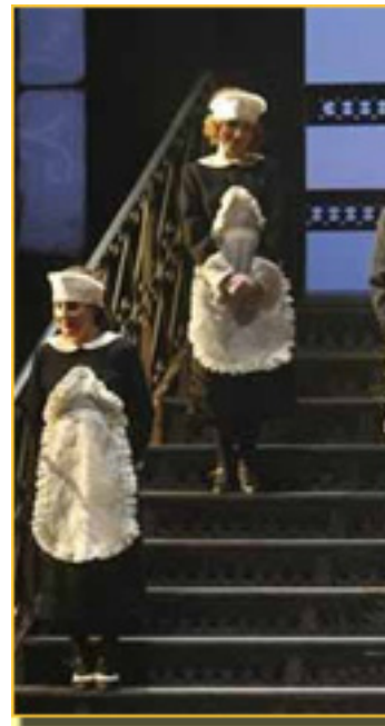
Soutullo y Vert

El Teatro de la Zarzuela , en esa tarea de recuperar títulos – en esta ocasión no del todo desconocido – apechuga con La leyenda del Beso , que no es zarzuela fácil. No lo es, tanto por el propio texto como por la partitura.