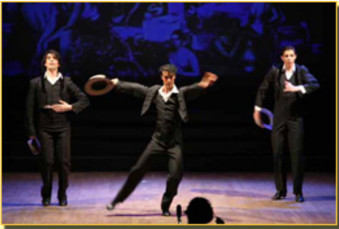
ESCENAS ANDALUZAS (ZAPATEADO) (ANTOLOGÍA DE LA ZARZUELA, 2008)

En todos estos años la Zarza de la Zarzuela ha sido el grato espectáculo de todos.