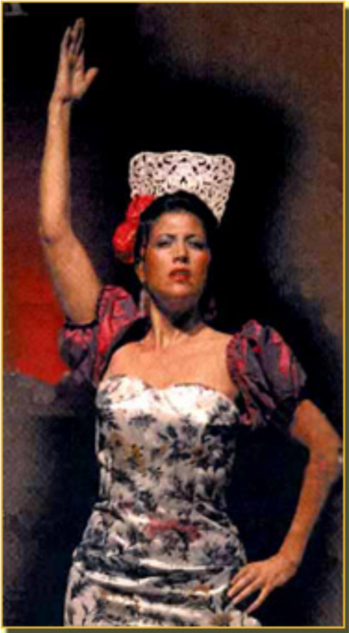
LA MARCHENERA (ANTOLOGÍA DE LA ZARZUELA, 2008)

Sábado, 20 de Marzo de 2010 16:36 - Actualizado Sábado, 08 de Mayo de 2010 11:24