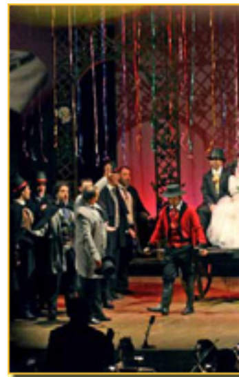
DOÑA FRANCISQUITA (CANTO ALEGRE A LA JUVENTUD) (ANTOLOGÍA DE LA ZARZUELA, 2008)

A FINALES DE LOS AÑOS CINCUENTA DEL SIGLO XX, URGÍA LA NECESIDAD DE UNA RENOVACIÓN