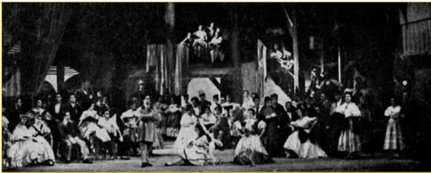
DOÑA FRANCISQUITA (CANCIÓN DEL MARABÚ (1956. TEATRO DE LA ZARZUELA, director: JOSÉ TAMAYO)

A FINALES DE LOS AÑOS CINCUENTA DEL SIGLO XX, URGÍA LA NECESIDAD DE UNA RENOVACIÓN