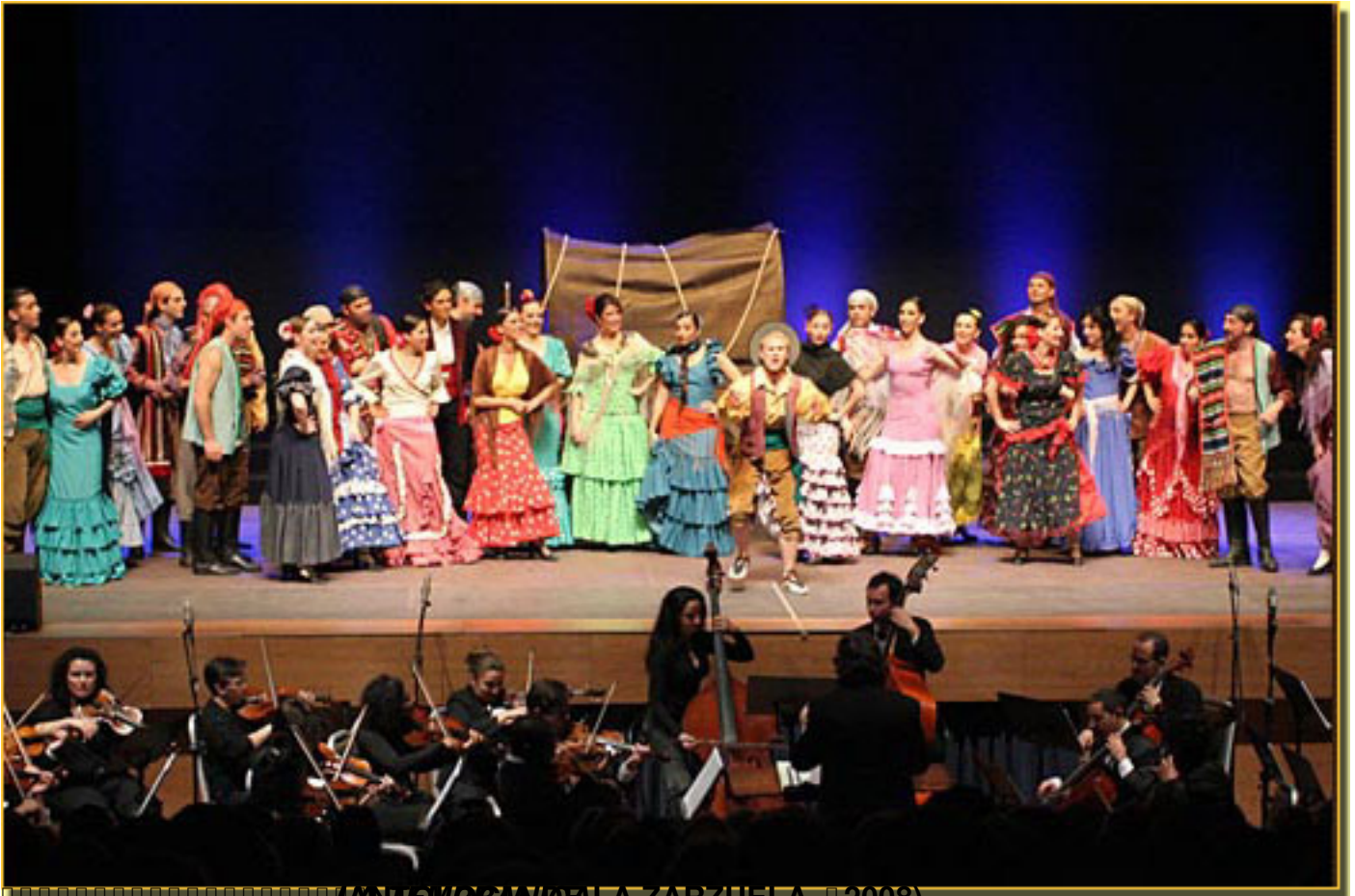
(ANTOLOGÍA DE LA ZARZUELA, 2008)