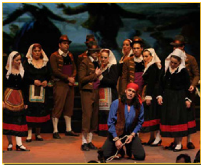
LA LINDA TAPADA