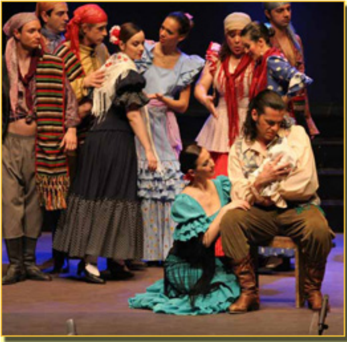
LA TEMPRANICA (ANTOLOGÍA DE LA ZARZUELA, 2008)

La Fundación Aladina ha instalado en la zona de oncología una red WiFi , queda acceso gratuito a Internet a todos los pacientes. También tiene un servicio diario de préstamo de ordenadores, consolas, videojuego y películas. El slogan que les guía es: