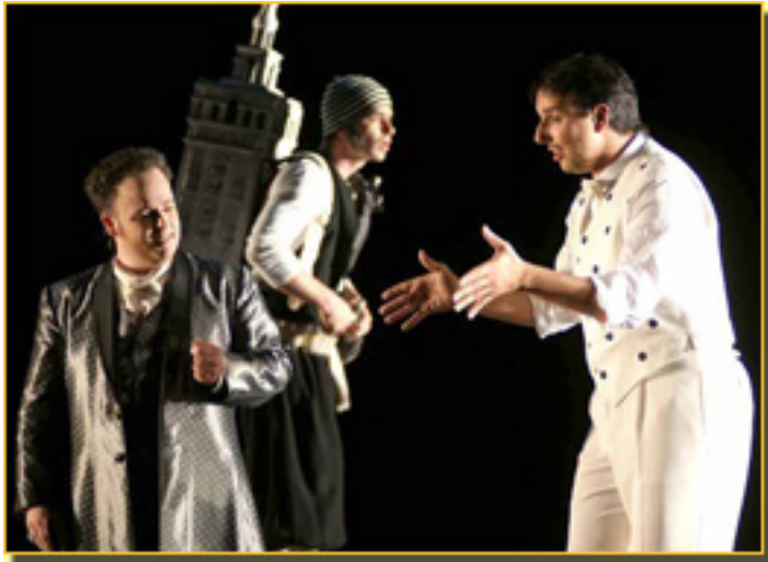
EL BARBERO DE SEVILLA