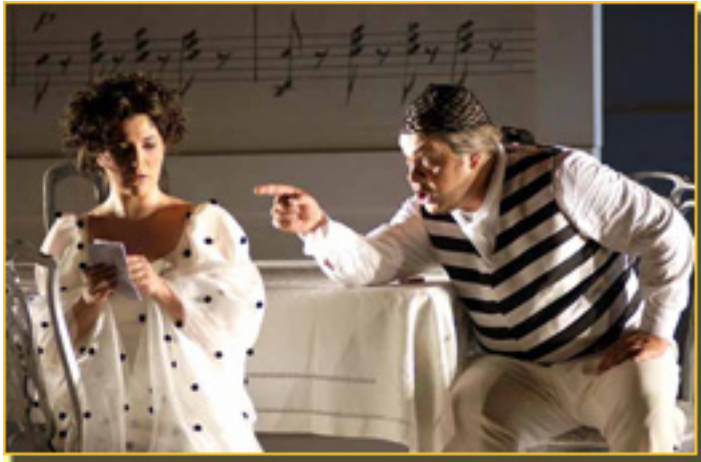
EL BARBERO DE SEVILLA

Sábado, 20 de Marzo de 2010 11:01 - Actualizado Sábado, 08 de Mayo de 2010 11:35