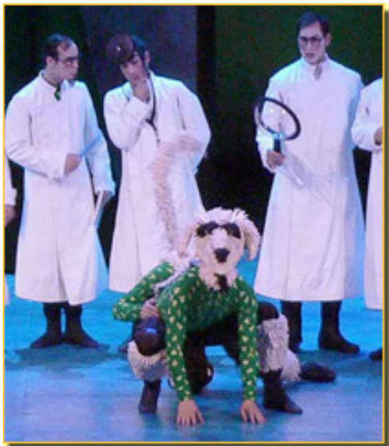
EL REY QUE RABIÓ (2007)