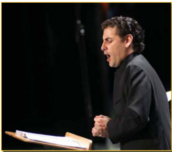
JUAN DIEGO FLÓREZ