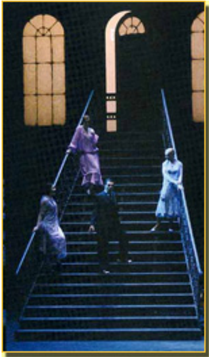
Castejón