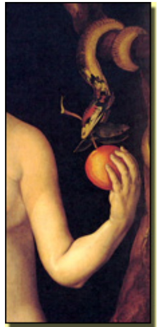
A. DURERO (1507)

Ahora exigimos como la hora y media de espectáculo y programar este género chico no es fácil. Hay que dar al respetables dos obritas. Entonces ¿cuál es el criterio a seguir? ¿Mismo compositor? ¿Misma época? ... Siempre la incertidumbre.