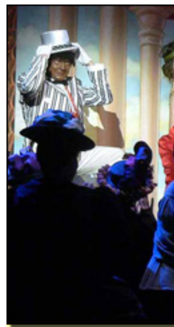
FOTO: JESÚS ALCÁNTARA .. Hija legítima del anticlericalismo galdosiano... e

Las Bribonas , ahora nos resulta inocente, pero para algunas voces del 1908 no debió ser así. El periódico El Universal escribía tras el estreno: