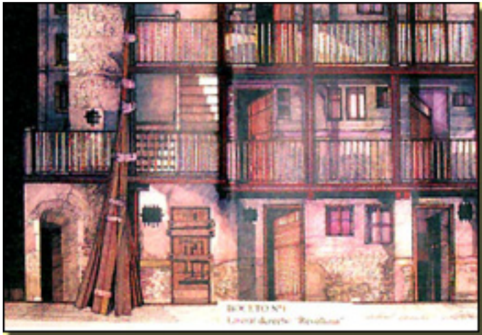
LA REVOLTOSA (BOCETO 2007)

Martes, 06 de Abril de 2010 07:37 - Actualizado Viernes, 07 de Mayo de 2010 19:47