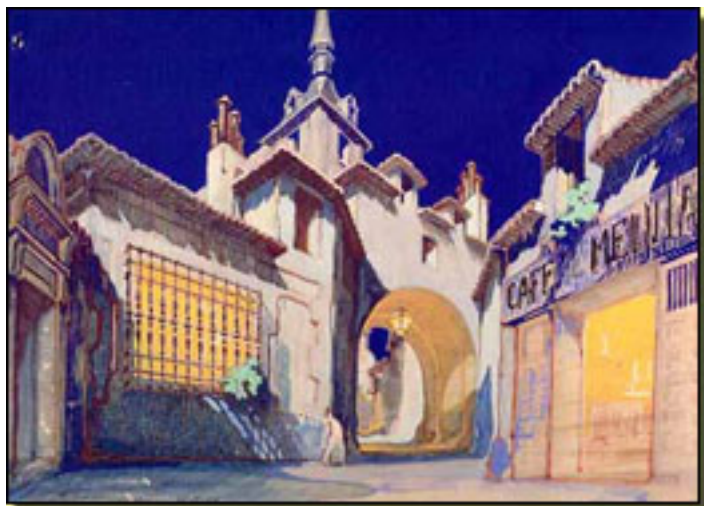
LA VERBENA DE LA PALOMA (1937)