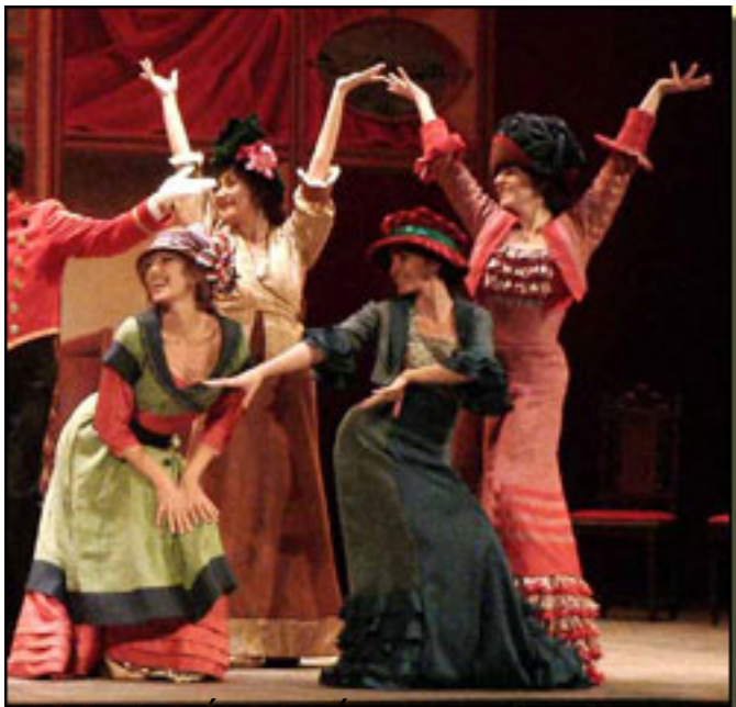
Las bribonas (1971), singing in the original production (1907) by Amelia

Viernes, 19 de Marzo de 2010 14:34 - Actualizado Viernes, 07 de Mayo de 2010 19:49