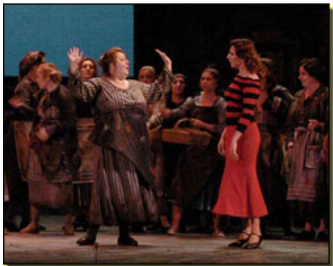
LA TABERNERA DEL PUERTO (2006)