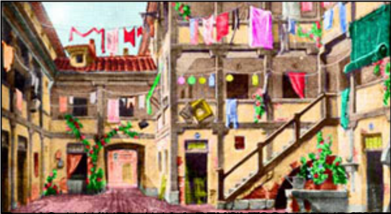
Escena de la obra Las bribonas.

Viernes, 19 de Marzo de 2010 14:34 - Actualizado Viernes, 07 de Mayo de 2010 19:49