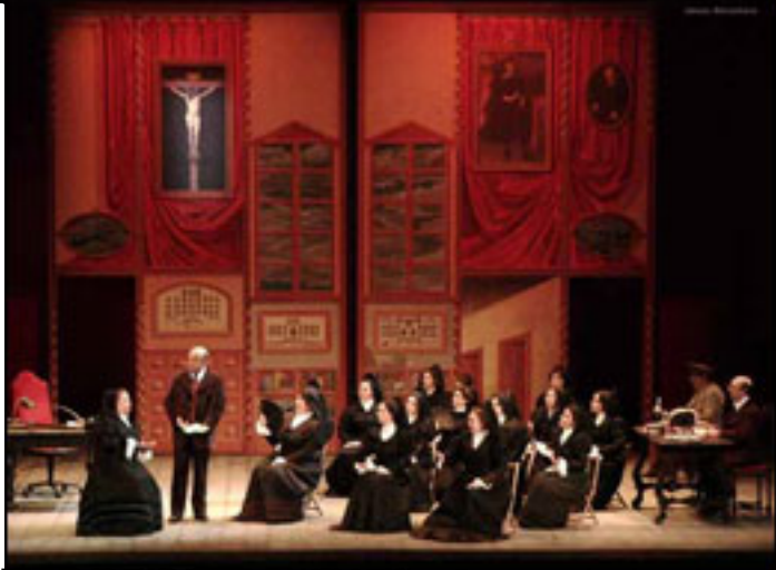
Escena de la obra Las bribonas.