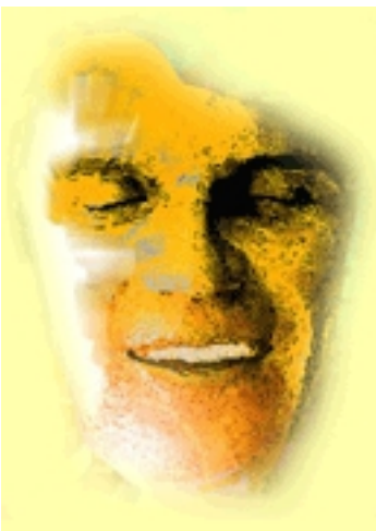
Escena de la obra Las bribonas.