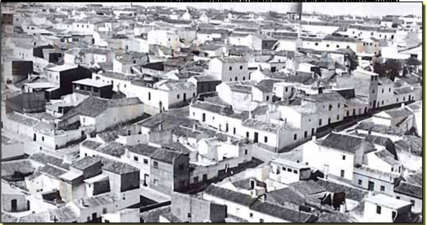
LA SOLANA, CIUDAD REAL