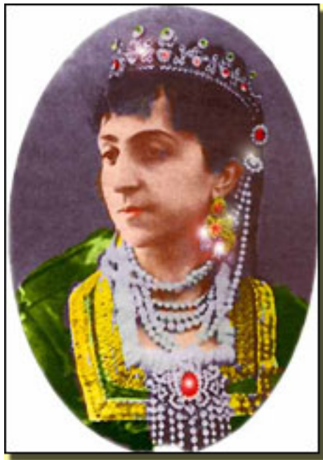
ALMERINDA SOLER (EL REY, 1891)

Viernes, 19 de Marzo de 2010 11:42 - Actualizado Sábado, 08 de Mayo de 2010 06:10