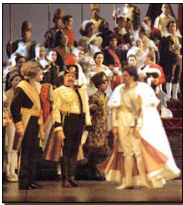
EL REY QUE RABIÓ (1996) (TEATRO DE LA ZARZUELA)

La investigación exhaustiva le ha llevado a Robert a afirmar: