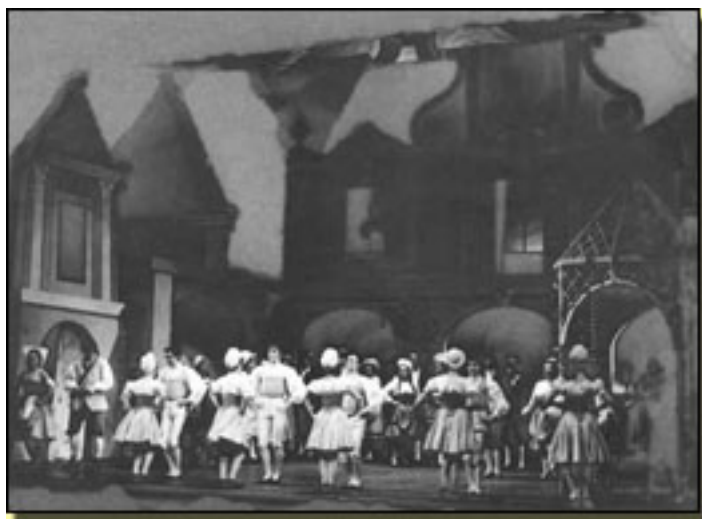
EL REY QUE RABIÓ (1965) (TEATRO DE LA ZARZUELA)

Y hay quien supone que el segador Se inclina tanto por ver mejor. Y ellos, pobrecitos, no piensan más Que en ir cortando espigas ¡ris-rás!, ris-rás!