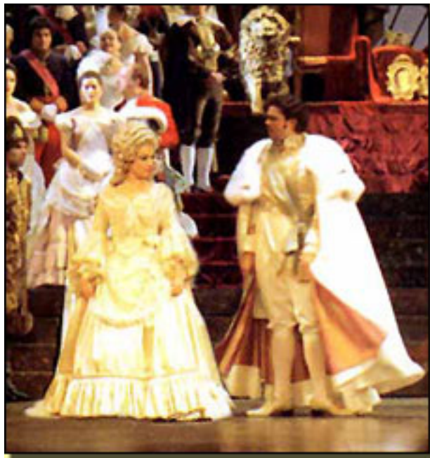
EL REY QUE RABIO (1996) TEATRO DE LA ZARZUELA

Viernes, 19 de Marzo de 2010 11:42 - Actualizado Sábado, 08 de Mayo de 2010 06:10