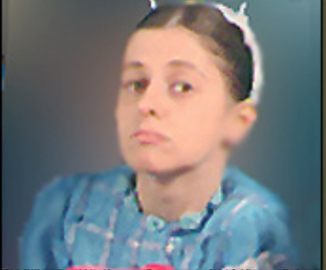
La actriz Alejandra Barros en una escena de la película 'El amor a distancia' (esquema)