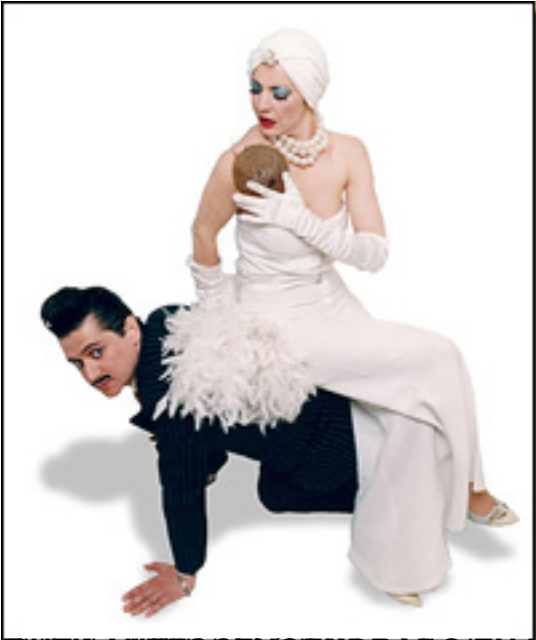
El actor José R. Díaz Sande en una escena de la película 'El amor a distancia' (esquema)

Viernes, 19 de Marzo de 2010 17:24 - Actualizado Sábado, 08 de Mayo de 2010 07:53