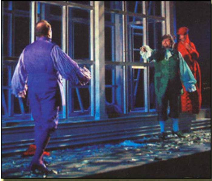
IL TUTORE BURLATO, 2006