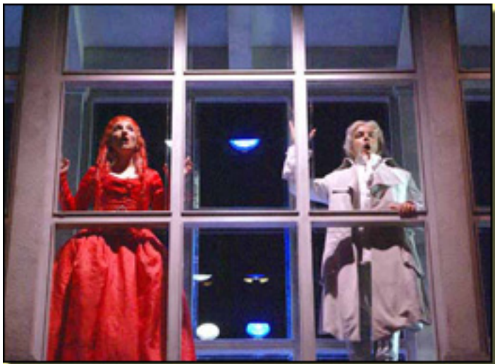
IL TUTORE BURLATO