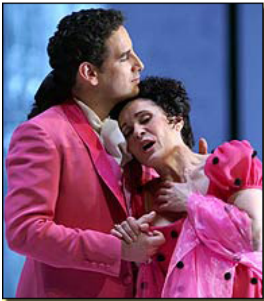
JUAN DIEGO FLOREZ/ MARÍA BAYO EL BARBERO DE SEVILLA (Versión de EMILIO SAGI)