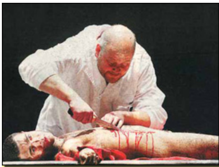
WOZZECK (TEATRO REAL)

- El criterio es que al público se le explique qué se está haciendo; si no se explica se trata de un espectáculo que no se puede hacer.