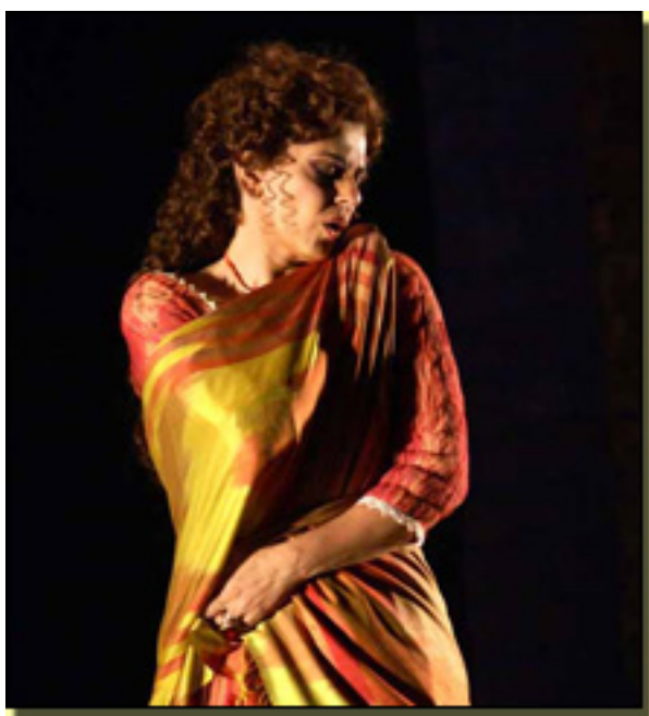
Il trovatore

- Cuando hay un texto, al leerlo cada vez puede ser distinto y traducir nuevos sentimientos, porque se lee con otras sensibilidad. Al mismo tiempo cada cantante traduce el texto de modo diferente y lo transforma. Hay que volver a integrar todo el conjunto. Incluso si fueran los mismos intérpretes, al llevarlo a otra ciudad, la comunicación sería diferente. Eso es lo que tiene el teatro. En este caso tengo otras personas, la orquesta es diversa, pero no menos bella. El modo de acercarse al mismo texto es diverso. □