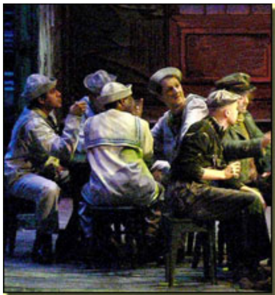
Las vicetiples quedaron Simpsonados en unos marines con pliscaeros (D

En esta versión la sorpresa Simpson , según Luis Olmos : - Yo siempre he visto a Simpson como un hombre de color Iván García a presencia de