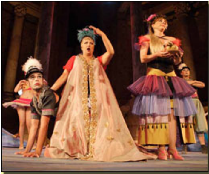
El joven Telémaco

Llegó a tener 33 representaciones seguidas y setenta y dos, durante la temporada. Llegó hasta los teatros privados como en el de la condesa de Montijo . Allí acudieron la infanta Isabel y su hija , los ministros de Brasil y de